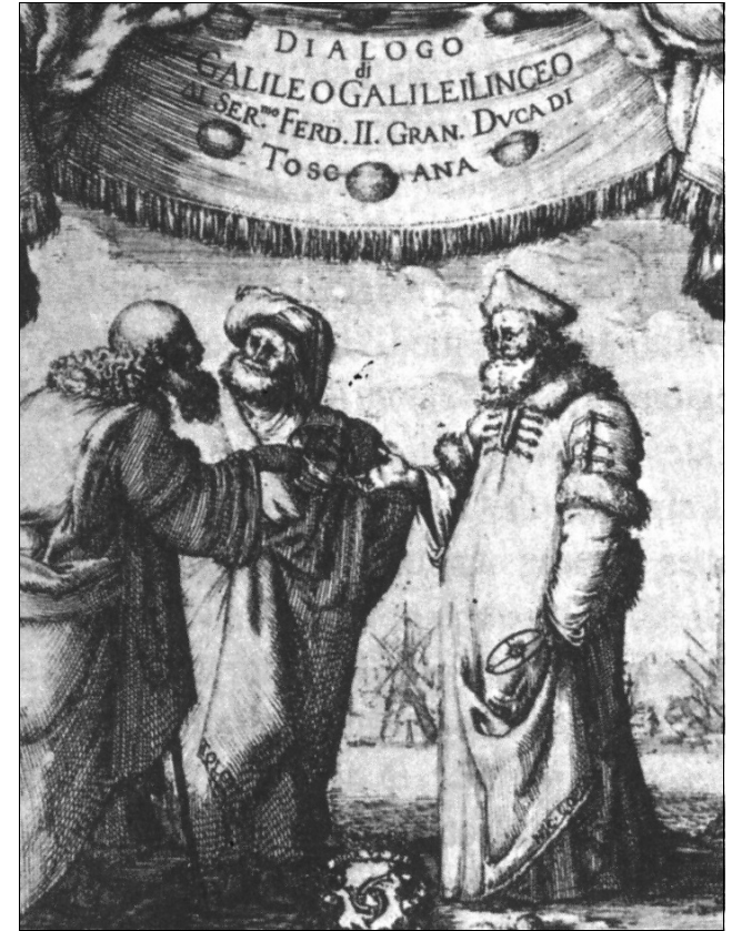
Permumyndin til Dialogo, útg. í 1632, hjá Galileo Galilei

skipanina hvarv, men so var ikki. Katólska kirkjan helt treiskliga fast við sítt. Í 1616 verður Revolutionibus hjá Kopernikusi sett á svartalista, 73 ár eftir útgávuárið. Kirkjan fordómir eisini arbeiðið hjá Galilei.