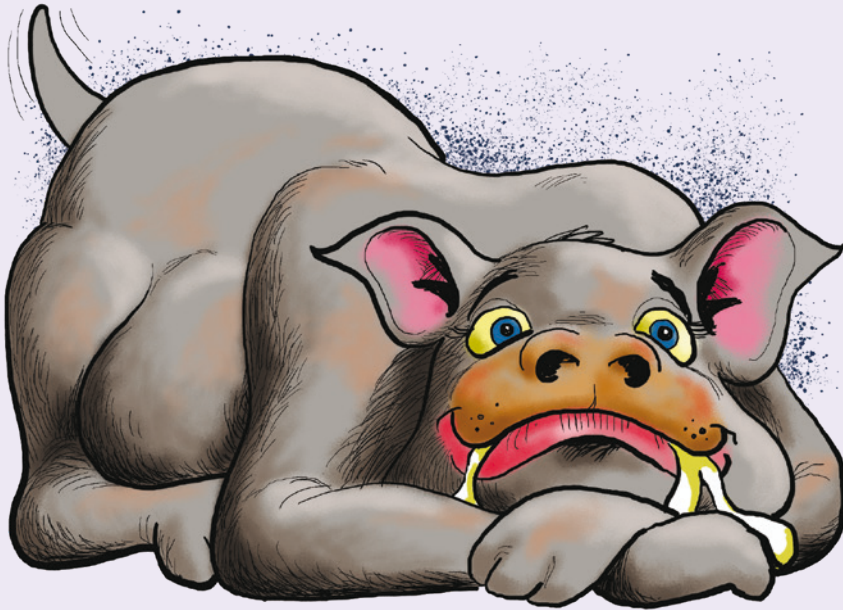
[STÓRUR, TJÚKKUR, BLÍÐUR]

Her er frágreiðing um samheiti og andnefni