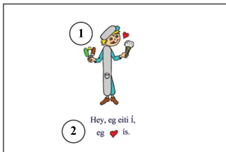
Mynd 4 – Íí

Vit enda hvørja ferð framløguna við bókstavinum.