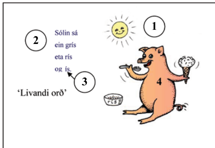
Mynd 3 – Íí

Mynd 3 verður gjøgnumgingin á sama hátt sum undanfarna.