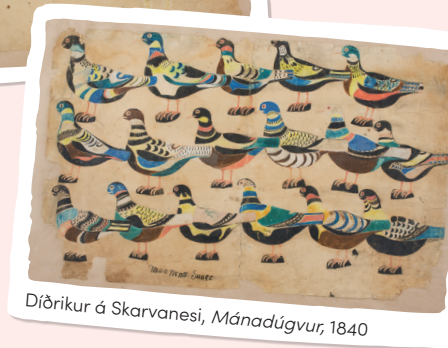
Díðrikur á Skarvanesi, Mánadúgvur, 1840