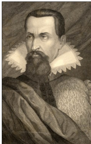
Johannes Kepler, 1571-1630, týskur stjørnufrøðingur og alisfrøðingur.

eitt sjúkligt barn. Hóast sjúkan hevur skatt bæði hendur og sjón - hann er nærsýntur og sær dupult - er hann viðskygdari enn tey flestu, ikki minst Tycho Brahe, og vitinum bagir einki.