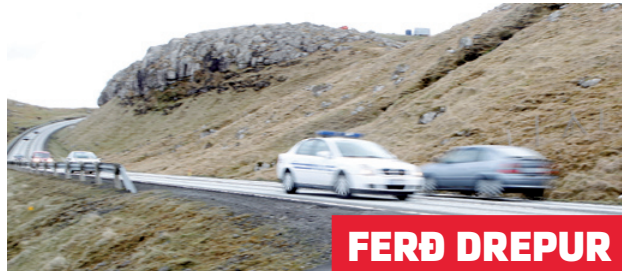
Ferðin er størsti dreparin í ferðsluni. Eisini miðal hampa fólk koyra ov skjótt og nú vil Ráðið Fyri Ferðslutrygd hava okkum at taka fótin av spidarandum.

– Tað rínur heldur ikki við tey, at tey fáa bót ella klipp í kortið. Tað einasta, tey eru bangin fyri, er, at mistak koyrikortið, og kanska enn tá starvið.