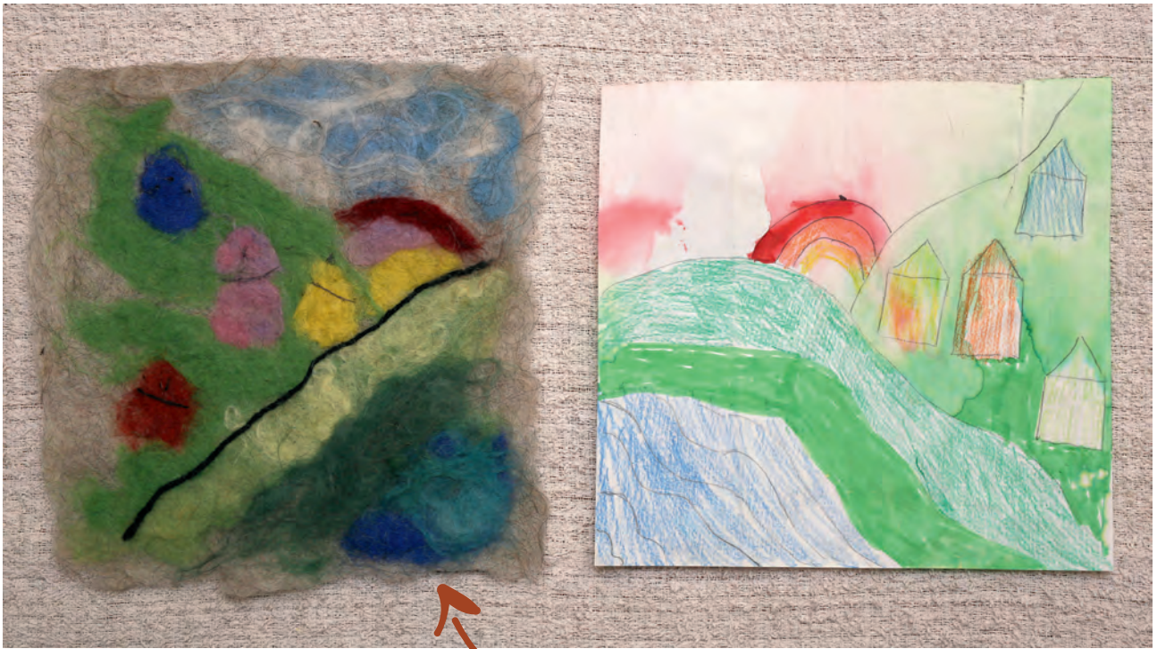
Poula, 7 ár

Tær hava sjálvar teknað og tøvt myndirnar. Mannagongdin er tann sama, sum tann á s. 171.