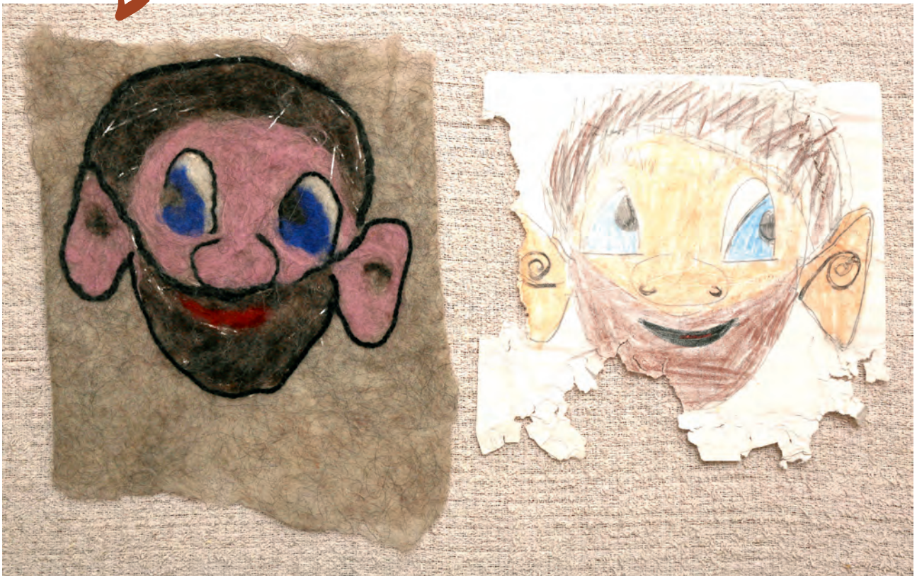
Gylta, 10 ár