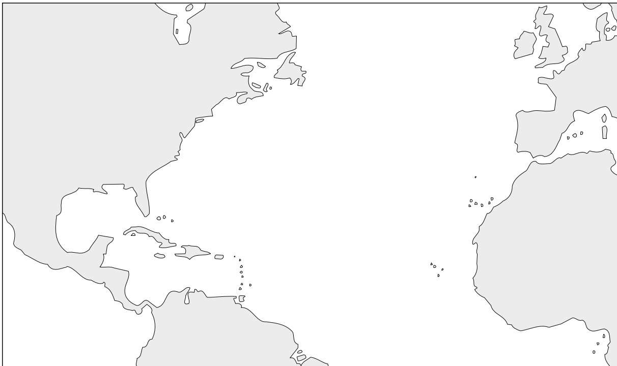
Kort: Stig Söderlind